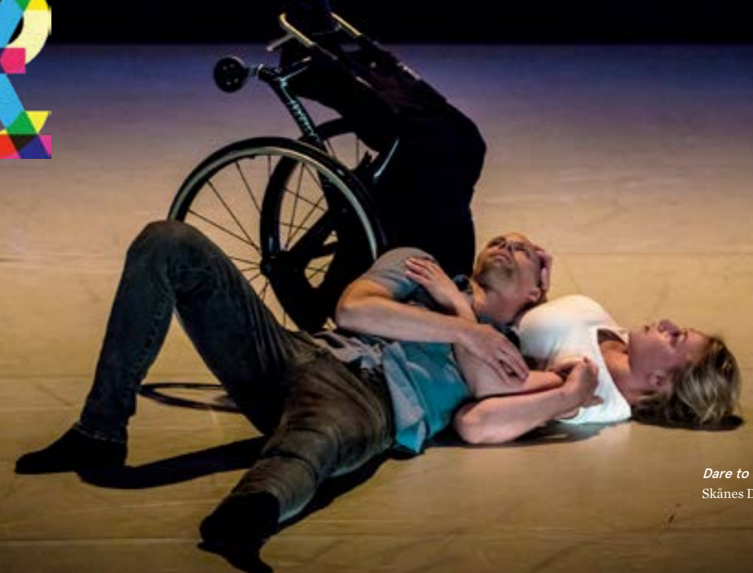
Dare to Wreck Skånes Dansteater