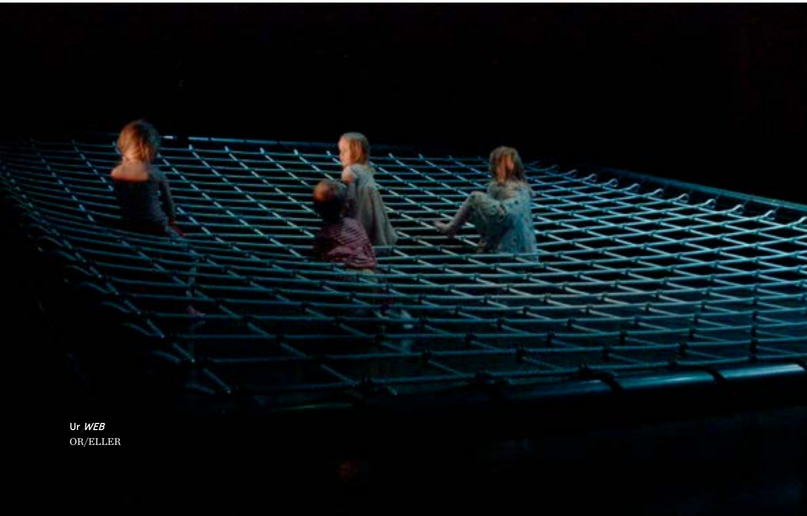
Ur WEB OR/ELLER

*Under 2019 tog Dansens Hus bort priskategorin "studenter". Detta innebär att denna grupp inte längre kan särredovisas.