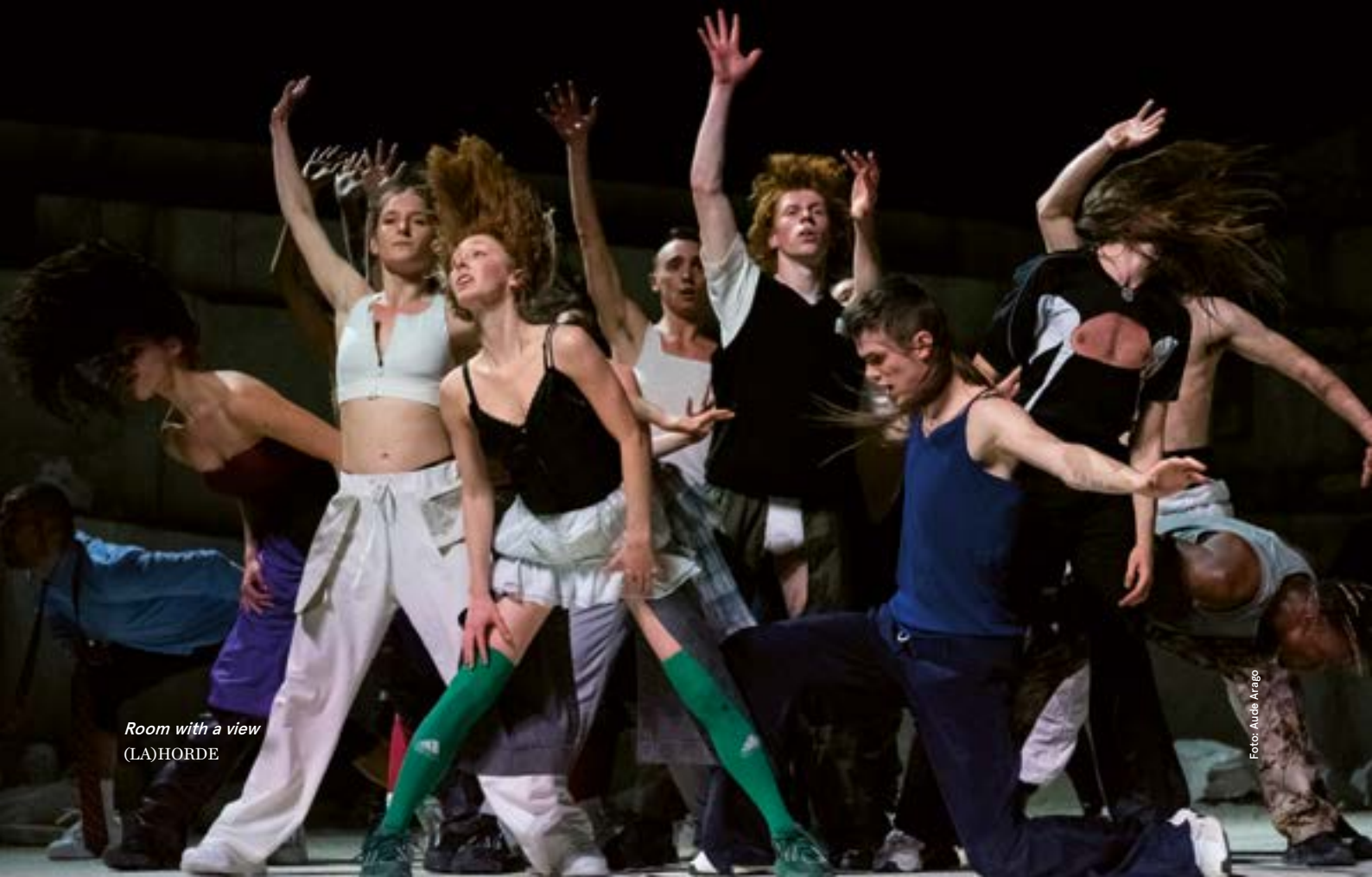
Room with a view (LA)HORDE