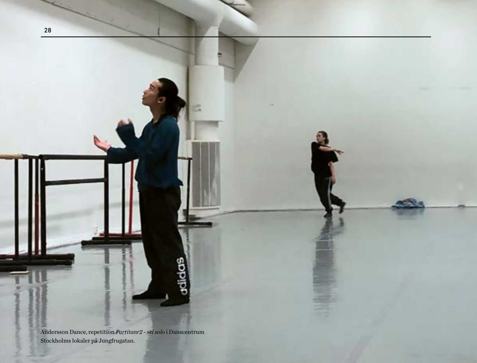
Andersson Dance, repetition Partitanr2 - sei solo i Danscentrum Stockholms lokaler på Jungfrugatan.